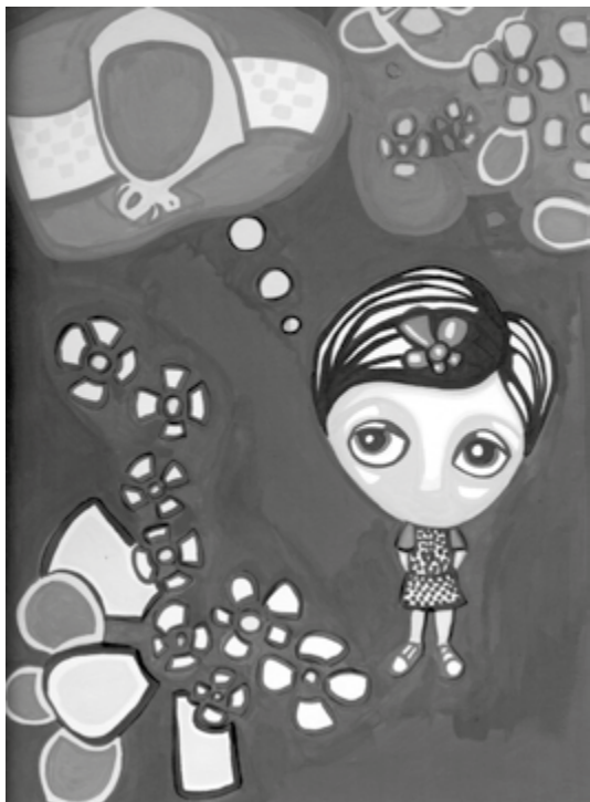
Acuarela, de Ivana Alan para mvj.unter.org.ar