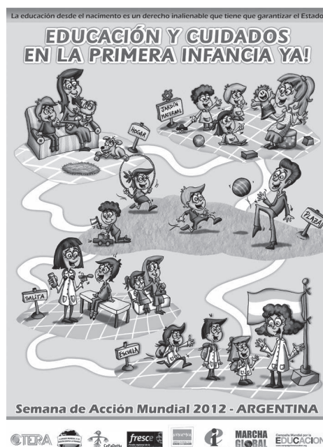
Afiche semana de Acción Mundial 2012, Argentina