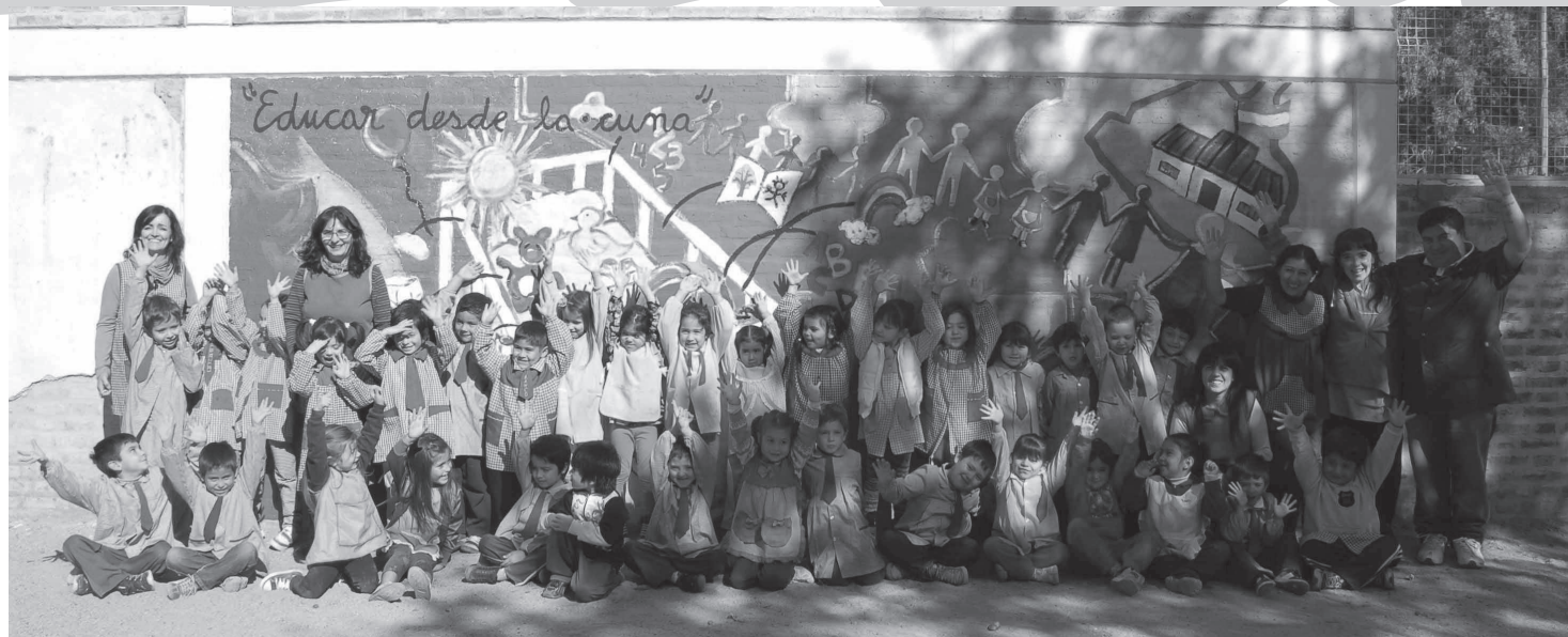
Mural realizado por la Juventud de la CTA Río Negro, en el Jardín Nº 54 de Fiske Menuco, en el marco de la Semana de Acción Mundial con el lema "Educar desde la Cuna"

Desde el sindicato y a través de las y los compañeros docentes se convocó a niñas y niños de 4 a 8 años a dibujar utilizando cualquier técnica, situaciones en las que se sintieron personas cuidadas, también a exponer los trabajos en una muestra