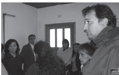
Entrevista con Fiscal Fernández, realizada en El Bolsón el 26 de abril de 2012

UnTER Central, UnTER Seccional El Bolsón, CTA Regional Bariloche - Bolsón, junto a otras organizaciones de Derechos Humanos acompañaron, el 26 de abril, a familiares de Guillermo "Coco" Garrido a una entrevista con el Fiscal Eduardo Fernández de la Fiscalía N° 4 de Tribunales de Bariloche que interviene en la causa por el presunto asesinato de Garrido.