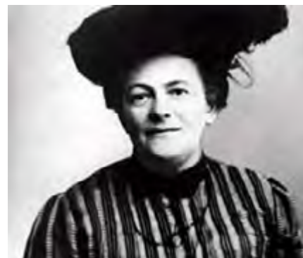
Clara Zetkin, política socialista. Debido a su obstinada lucha, las mujeres alemanas consiguieron el derecho al voto en 1918. Tuvo un rol fundamental en los progresos del movimiento de emancipación de las mujeres, a principios del Siglo XX.

Conferencia Internacional de Mujeres Socialistas, que se lo instituyera para promover el movimiento de defensa de los derechos de las mujeres. Una versión asevera que es el 8 de marzo para resignificar el día en que en 1857 mujeres trabajadoras fueron ferozmente reprimidas por reclamar mejores condiciones laborales. La otra plantea que fue en homenaje póstumo y en recuerdo de las 129 obreras carbonizadas en la fábrica textil de Nueva York , a raíz de un incendio que se produjo luego de que los dueños las encerraran para impedirles salir a protestar. Muy lejos de esta significación se hallan las celebraciones vaciadas de este componente vital de lucha, de este grito de mujeres trabajadoras que se animaron a pelear contra la explotación del patrón y del patriarcado . Aún hoy persisten discriminaciones y desigualdades en el mundo laboral : la brecha salarial entre varones y mujeres, menores posibilidades de acceso a empleos calificados, la invisibilización de trabajos socialmente descalificados como por ejemplo la crianza de niños y niñas y los de cuidado que son responsabilidades familiares compartidas . (Convenio 156, OIT).