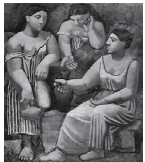
“Tres mujeres en la fuente” Pablo Picasso.

• Guía de orientación para docentes “La Educación Sexual en las aulas”: editada por CTERA , aporta información y plantea actividades de debate acerca de mitos y prejuicios y su confrontación con la realidad.