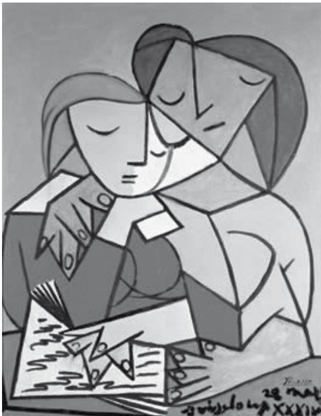
“Dos mujeres leyendo”. Pablo Picasso

Este Día Internacional de la Mujer, como Trabajadoras y Trabajadores de la Educación, sintámonos convocadas y convocados al esfuerzo constructivo y sumamente revolucionario de trabajar por la creación de vínculos de paridad y de auténtica igualdad, en pos de una sociedad incluyente, solidaria, justa y democrática.